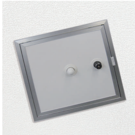
天井埋込型 型式 B-2 オープン価格