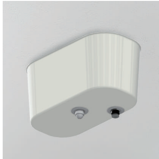
天井吊下型 型式 B-1 オープン価格

MY BUDDY <マイ・バディ> 本体のカバーを 2 種類ご用意しました。設置場所のイメージに合わせて、主張しすぎない『天井吊下型』か、スタイリッシュな『天井埋込型』をお選びください。