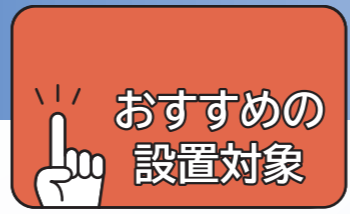
神社・仏閣・仏間

火災リスクに備えて福祉施設、倉庫、工場などに自動消火装置を導入することで安全性が向上します。